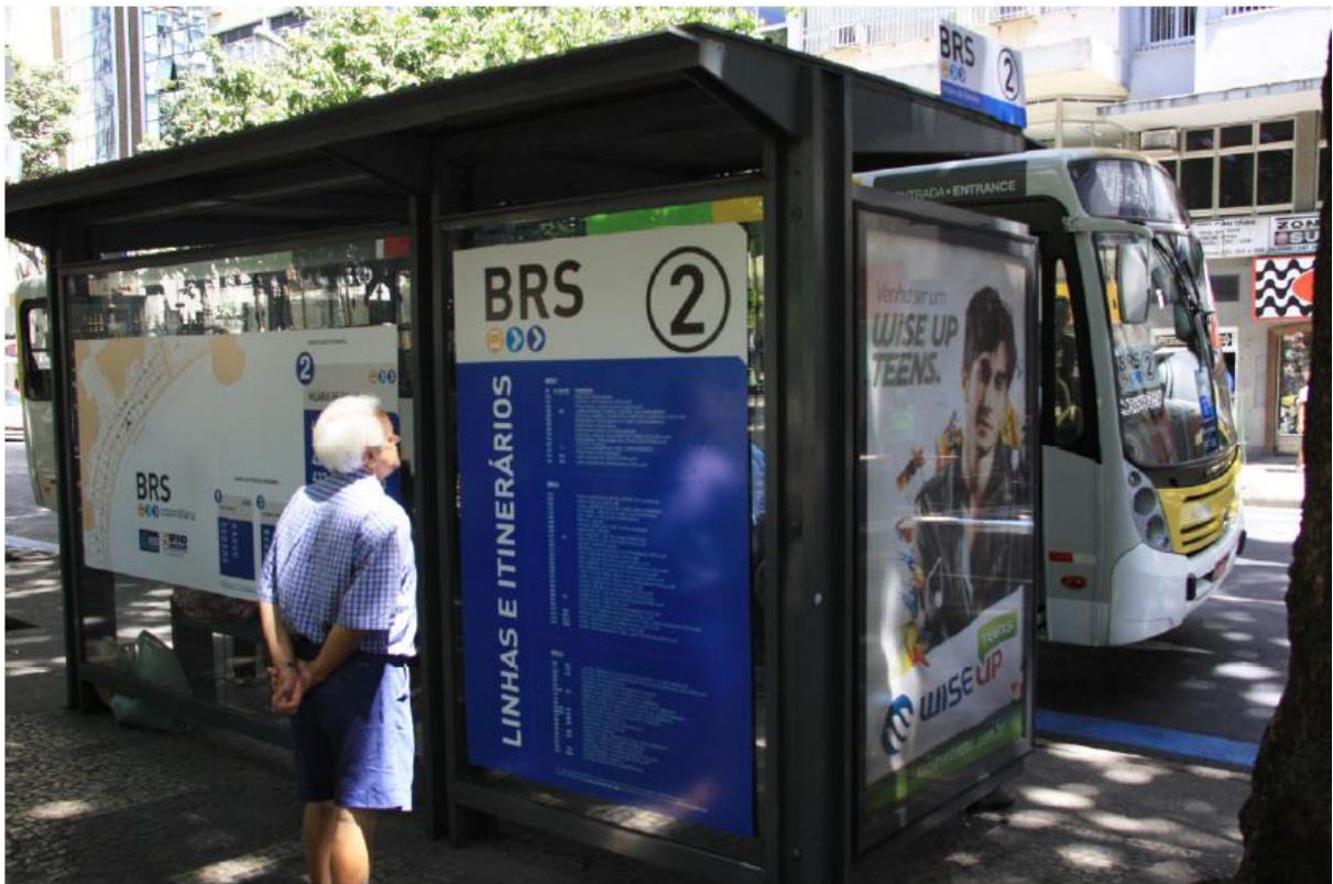
Foto: BRS Rio de Janeiro: ponto de embarque e desembarque com informações para os usuários – Crédito: Fetranpor.

Os usuários devem ser informados sobre os padrões preestabelecidos de qualidade e quantidade dos serviços ofertados, inclusive com informações disponibilizadas nos pontos de embarque e desembarque como itinerários, horários e tarifas.