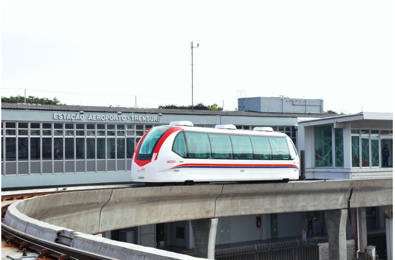
Foto: Aeromóvel que interliga a Estação Aeroporto do Metrô ao Terminal 1 do Aeroporto Internacional Salgado Filho, em Porto Alegre/RS.

Reavaliação do valor acordado que visa manter o equilíbrio econômico-financeiro quando este é rompido por fatores intervenientes.