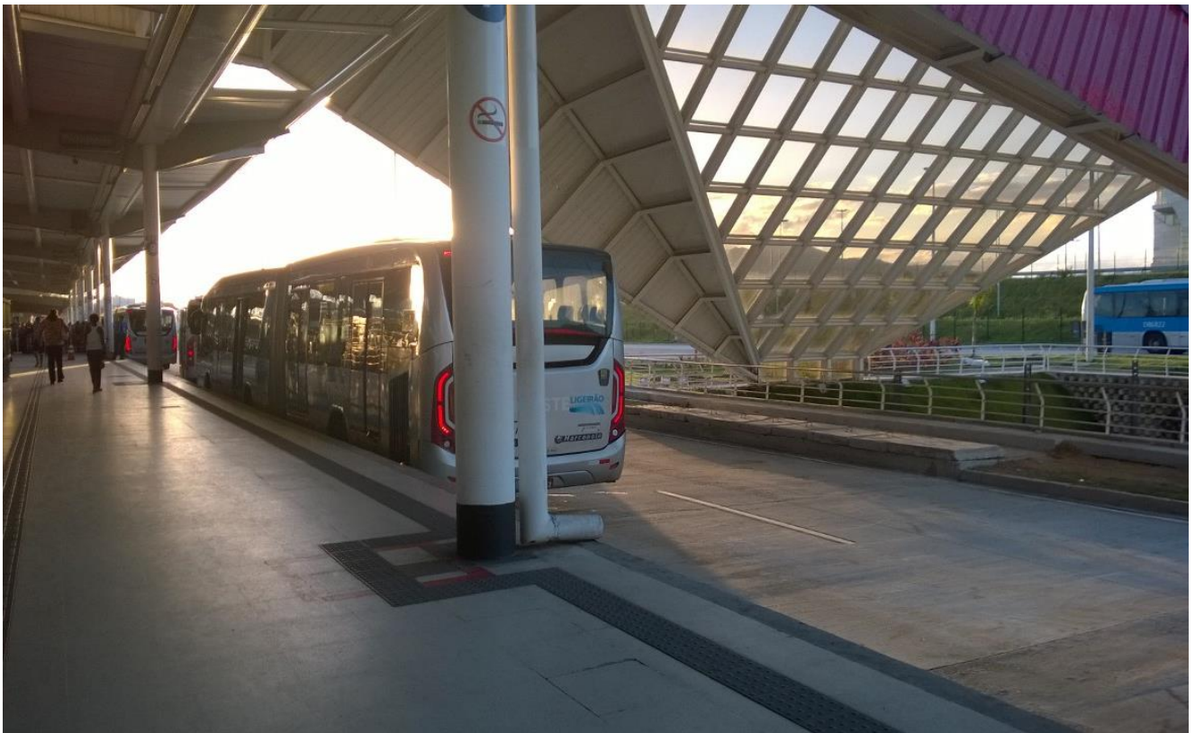
Foto: Terminal Alvorada – BRT Transoeste, Rio de Janeiro/RJ.

Um ônibus comum transporta em média a mesma quantidade de passageiros que 50 automóveis, o que justifica que os ônibus possuam um espaço exclusivo nas vias garantindo a fluidez de um número muito maior de passageiros com menor poluição do meio ambiente. A maior eficiência da operação do transporte coletivo, com o aumento da velocidade média, economia de tempo, combustível e outros insumos, diminui os custos da operação possibilitando redução de tarifa aos usuários. Os modos não motorizados de transporte favorecem a utilização do espaço urbano pelo cidadão.