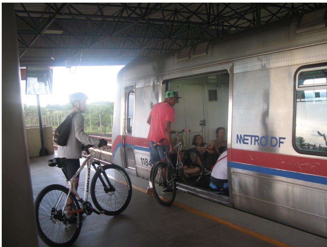
Foto: Embarque de bicicletas no Metrô do Distrito Federal.

Os municípios devem planejar e executar a política de mobilidade urbana. Nos locais em que os serviços têm caráter metropolitano, os Estados ou um consórcio de municípios devem planejar a integração dos modos de transporte e serviços. Para isso, devem elaborar conjuntamente estudos e planos integrados de mobilidade urbana.