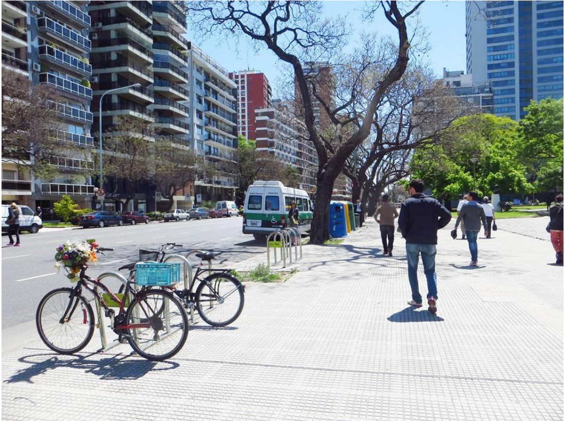
Foto: Ampla calçada para a circulação de pedestres com infraestrutura para bicicletas.